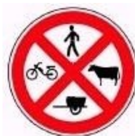
Trânsito proibido a peões, a animais e a veículos que não sejam automóveis ou motociclos