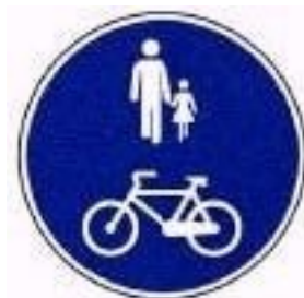
Pista obrigatória para peões e velocípedes