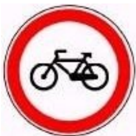
Trânsito proibido a velocípedes