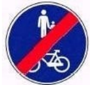
Fim da pista obrigatória para peões e velocípedes