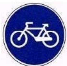
Pista obrigatória para velocípedes

Estas vias estão identificadas no seu início com a seguinte sinalização: