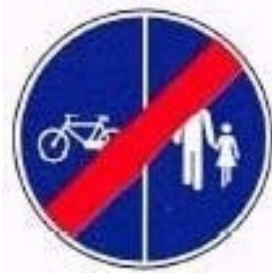
Fim da pista obrigatória para peões e velocípedes (com separação)