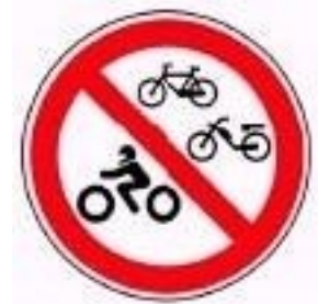
Trânsito proibido a veículos de duas rodas