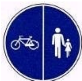
Pista obrigatória para peões e velocípedes [com separação]