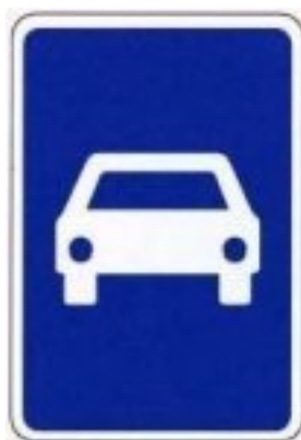
Via reservada a automóveis e motociclos