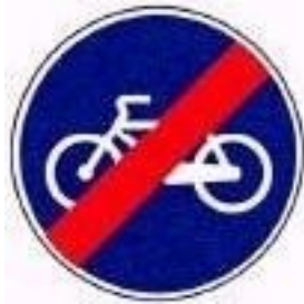
Fim da pista obrigatória para velocípedes

O fim das mesmas é indicado pelos seguintes sinais: